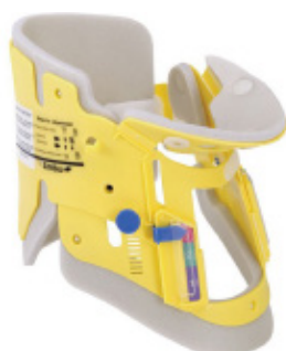
COLLAR CERVICAL AMBU Pediátrico Código RL310