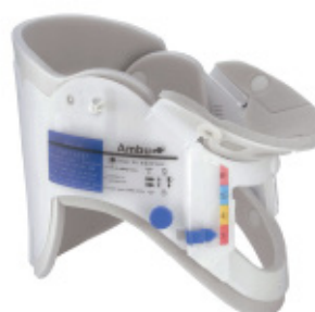
COLLAR CERVICAL AMBU Adulto Código RL312