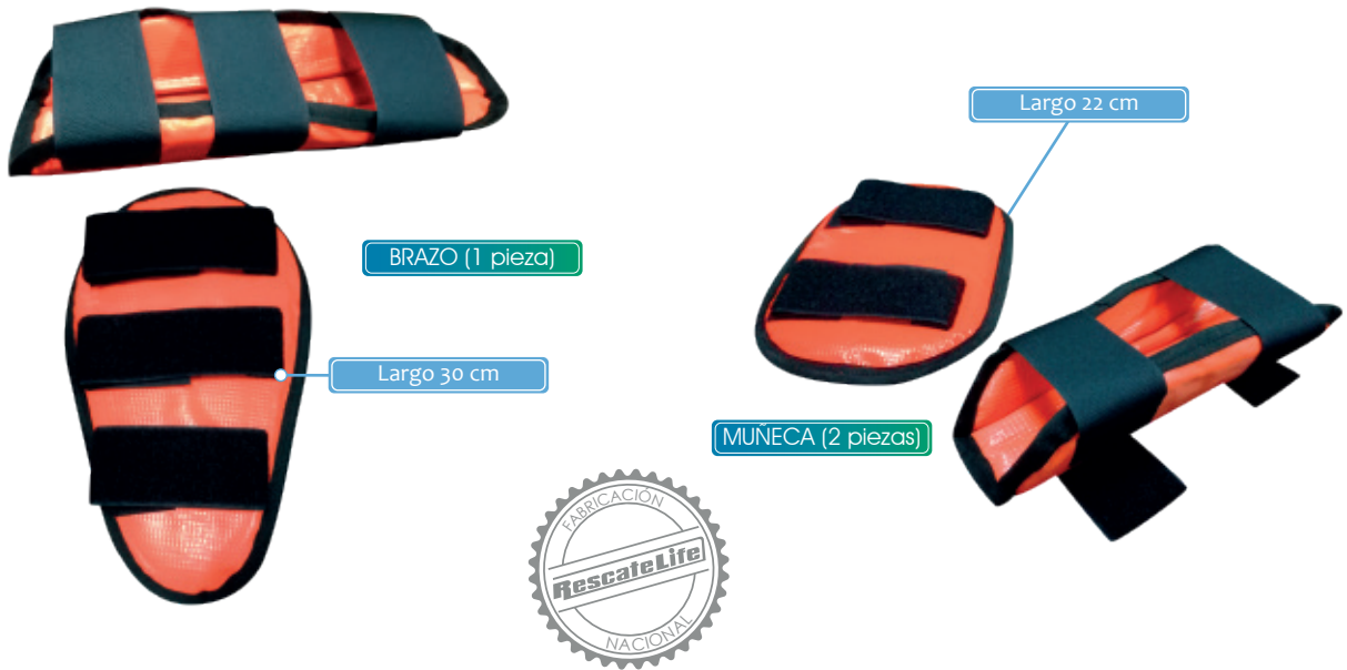
BRAZO (1 pieza)