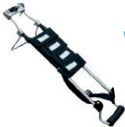
FÉRULA TRACCION Velcro Ajustable Código RL360