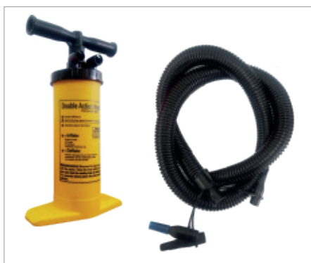
Incluye bomba de vacío y manguera para su conexión