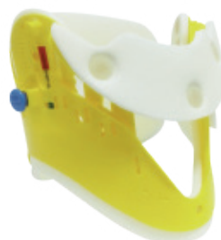
Collar Cervical Pediátrico 12 posiciones Código RL398