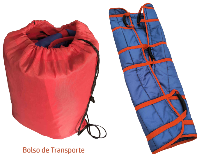
Bolso de Transporte

Diseñada con doble tela Oxford reforzada, combinación entre algodón y poliéster, de material suave, ligero y lavable. Posee un acolchado de Napa de 20 mm de espesor en su interior. Presentación en 3 tallas, Talla S (130 x 70 cms) , Talla M (160 x 80 cms) , Talla L (180 x 80 cms) . Cuenta asas que facilitan el agarre y la manipulación del paciente.