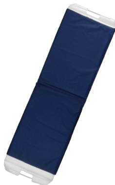
TABLA TRANSFERENCIA Plegable Código RL336