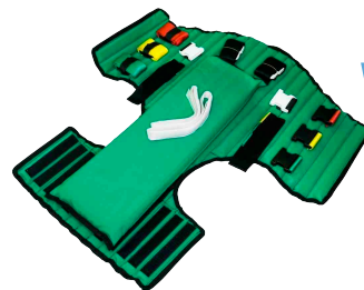
CHALECO EXTRICACION Uso Adulto Código RL831