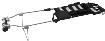
FÉRULA TRACCIÓN Tipo Davis Código RL360