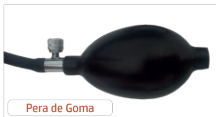
Pera de Goma