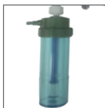
Humidificador Desechable 120 ml.