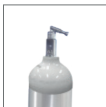
Para Balón Tipo Pin Index.